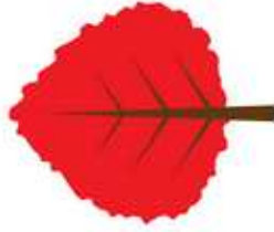
Une feuille rouge