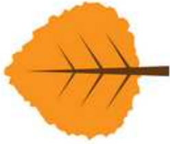
Une feuille orange