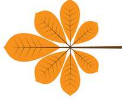
Une feuille de marronnier