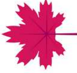
Une feuille d'érable