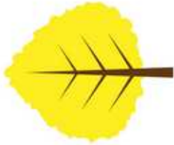
Une feuille jaune