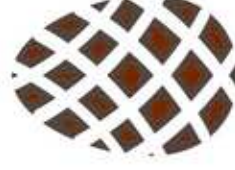
Une pomme de pin