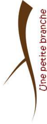
Une petite branche